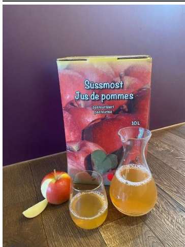
Süssmost vom Guglerahof