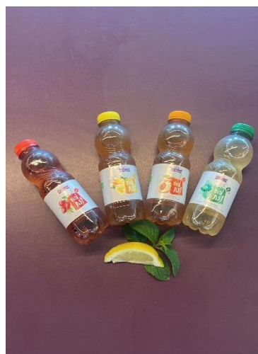
Diverse Sorten Eistee