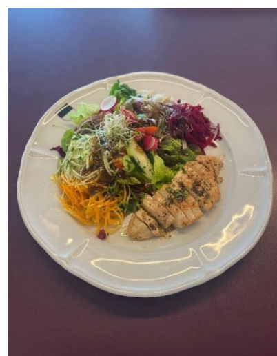
Gemischter Salat mit Beilage