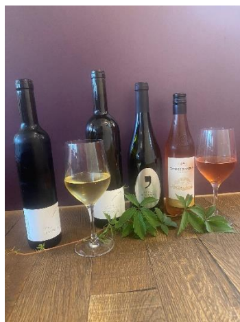
Weine im Offenausschank